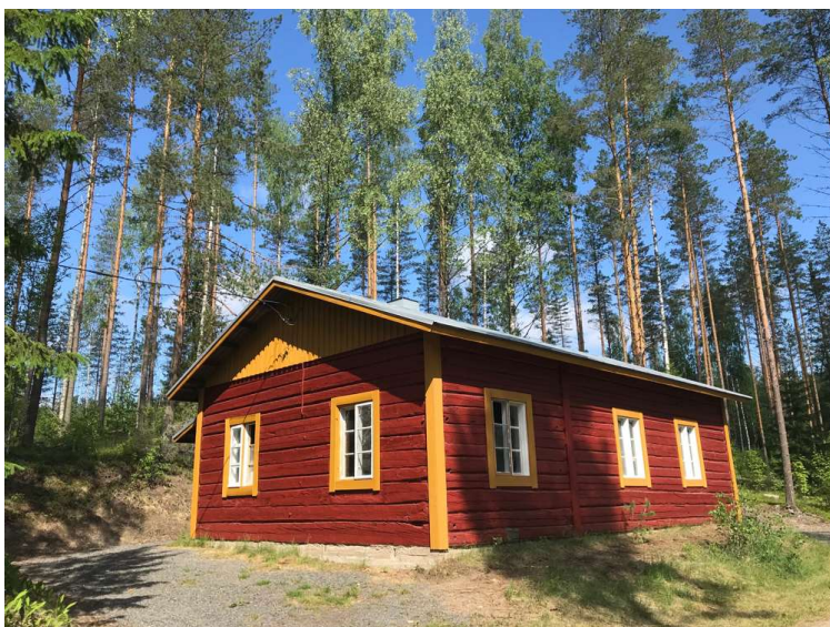
Ampumaradan pirtti ennen ja jälkeen kunnostuksen kesällä 2020.