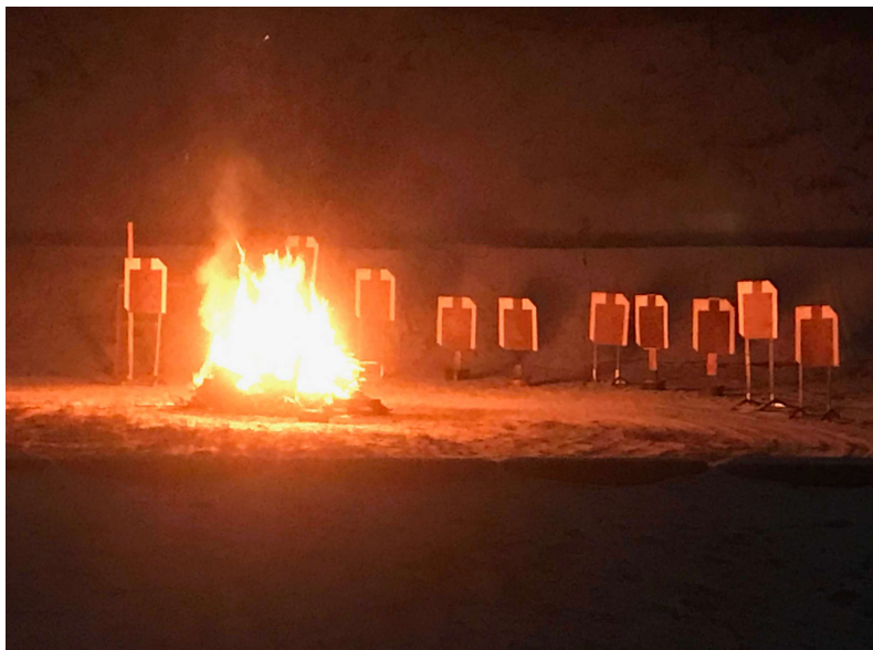
Joulutulilla ammittiin pimeästä nuotion kajossa oleviin tauluihin.

Reserviläisliiton valtakunnalliset Joulutulet järjestettiin kolmatta kertaa Korpilahden ampumaradalla. Tapahtuma järjestettiin pimeää ammustana jossa simuloitiin Talvisodan Tolvajärven yllätysiskua ampumalla nuotioitten kajossa olevia ampumatauluja perinne kivääreillä. Seitsemstäkymmenestä ”vihollisesta” saatiin osuma 28:aan ”viholliseen”. Ampujia oli yhteensä 14, joilla jokaisella oli käytettävissä 5 patruunaa ampumaetäisyyden ollessa 100 m.