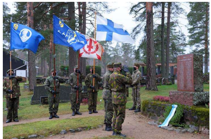
Seppeleen lasku sankarihaudoille 27.5.2020 ja oikealla vakaumuksen puolesta kaatuneiden muistomerkillä 6.12.2020.