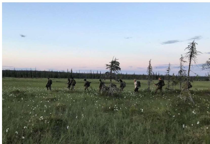
Marssiosaston kärki etenee kohti Vintilätunturia.